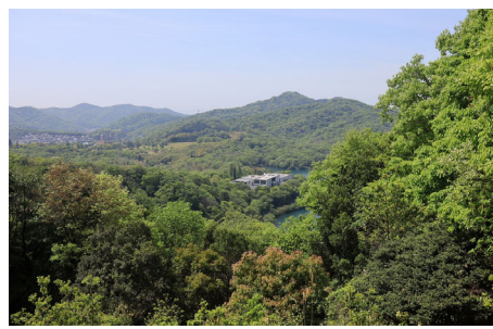
皆さんは大型連休をどのように過ごしておられるでしょうか。とはいっても、今年は前半と後半に完全に別れていて、前半の3連休も、最後の月曜日は授業日という有様。学生諸君にとっては、普通の土日と同じだったと思います。3日（金）から6日（月）は、授業も4連休となつていま

す。これらへの影響は、個々の企業や個人、さらには日本経済全体に影響を及ぼす可能性があります。したがって、円安の問題は確かに大きな問題と言えるでしょう。ただし、その影響は状況や視点によります。例えば、輸出業者にとっては、円安は輸出が増える可能性があるため、メリットとなる場合もあります。このように、円安の影響は多面的であり、その評価は容易ではありません。