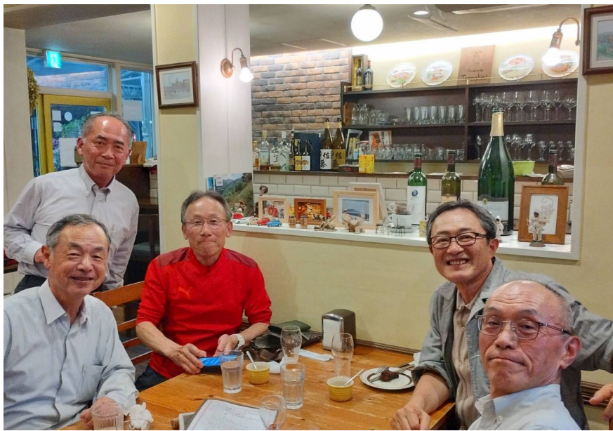
私の卒業した高校は、山口市の山口高校です。阪神地区在住（私は在住ではなくて、通勤）の友人が、数

名でミニ同窓会を年に1度程度開いています。最初は、私と、同級生2人の、計3名が岡本で行ったのですが、関西にはもともと学年の垣根を超えた同窓会があり、そのメンバーが加わって、少人数を増やして第2回を昨年開き、今回は、また新しいメンバーを加えて、甲子園近くのピザ屋「Torchicci」で、4月26日（金）に集まり、第3回目を開きました（写真）。